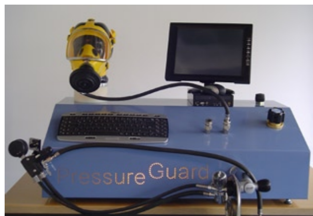
Möglicher Komplettbau des Pressure-Guard Prüfsystems.