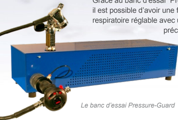
Le banc d'essai Pressure-Guard

Grâce au banc d'essai "Pressure-Guard", il est possible d'avoir une fréquence respiratoire réglable avec une grande précision des résultats par diminution du temps de réponse.