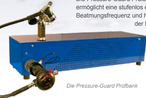
Die Pressure-Guard Prüfbank

Die Pressure-Guard Prüfbank ermöglicht eine stufenlos einstellbare Beatmungsfrequenz und hohe Exaktheit der Ergebnisse durch Minimierung des Totraumes.